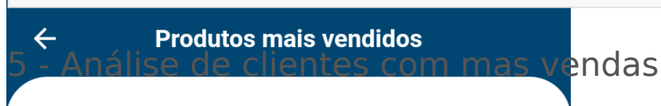
Imagem 5: Gráfico de pizza com os 10 produtos mais vendidos do período selecionado

Clicar no card Análise de clientes com mais vendas [Imagem 2] . Irá gerar um gráfico de pizza que mostra os 10 clientes que mais compraram do período selecionado.