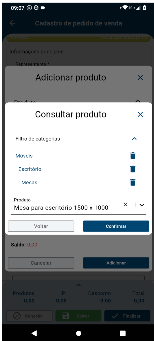
Imagem 4: Modal Inclusão item